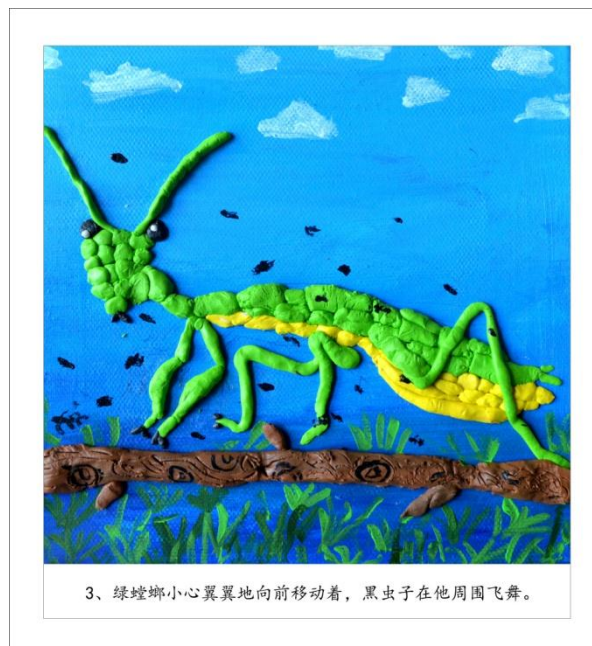
带文字的绘本画作品装裱样式：

如果需要文字说明，可以在画面下方距离 1mm 额外添加一条白底黑色打印字配置简单文字，如下图：